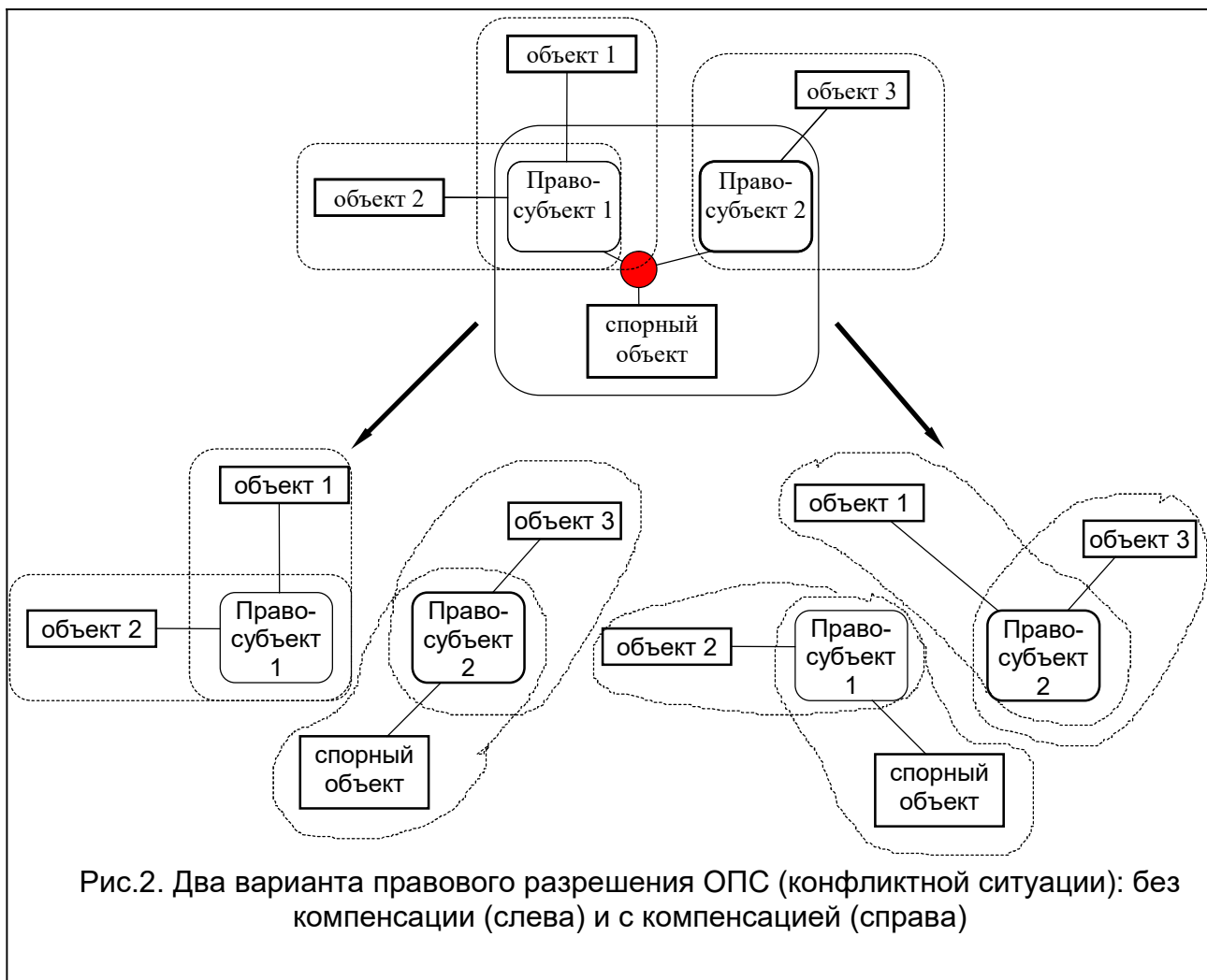
Рис.2. Два варианта правового разрешения ОПС (конфликтной ситуации): без компенсации (слева) и с компенсацией (справа)

Пояснения к рис. 2. В верхней части рисунка изображена схема ОПС совместно в четырем ОС (бесконфликтными ситуациями), связанными с данной ОПС (ОПС обведена сплошной скругленной линией, ОС - штриховой скругленной). Правовое решение в левой части соответствует простому отказу правосубъекта 1 в притязании на спорный объект, конфликт исчезает, все связи - двухконечные, бесконфликтные. Правовое решение в правой части соответствует компенсационному варианту, когда правосубъект 2 отказывается от притязаний на спорный объект, но получает в качестве компенсации полноценную связь с объектом 1, а правосубъект 1 получает полноценную связь со спорным объектом взамен за отказ от связи с объектом 1.